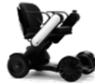
WHILL Model C

買い物や通院など自宅周辺のみ外出していた方も、外出先の選択肢が増え、行動範囲が広がります。