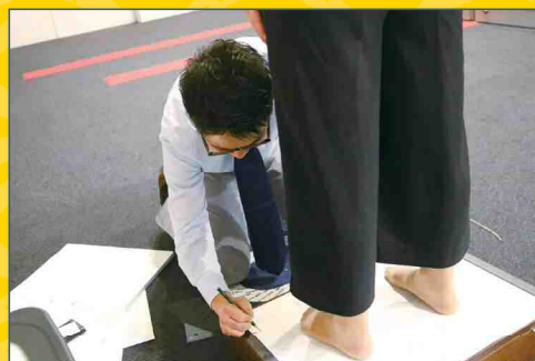
シューフィッター