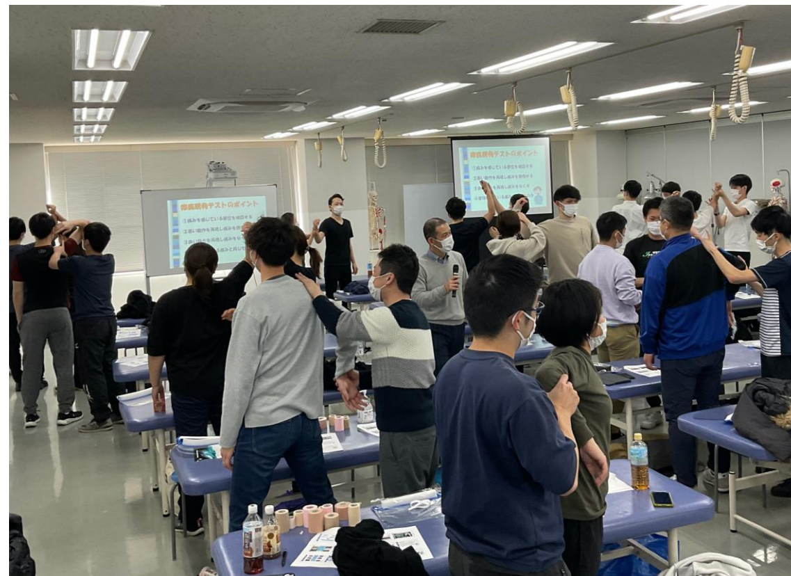
千葉先生の評価と実践を受講者同士でデモンストレーションする様子