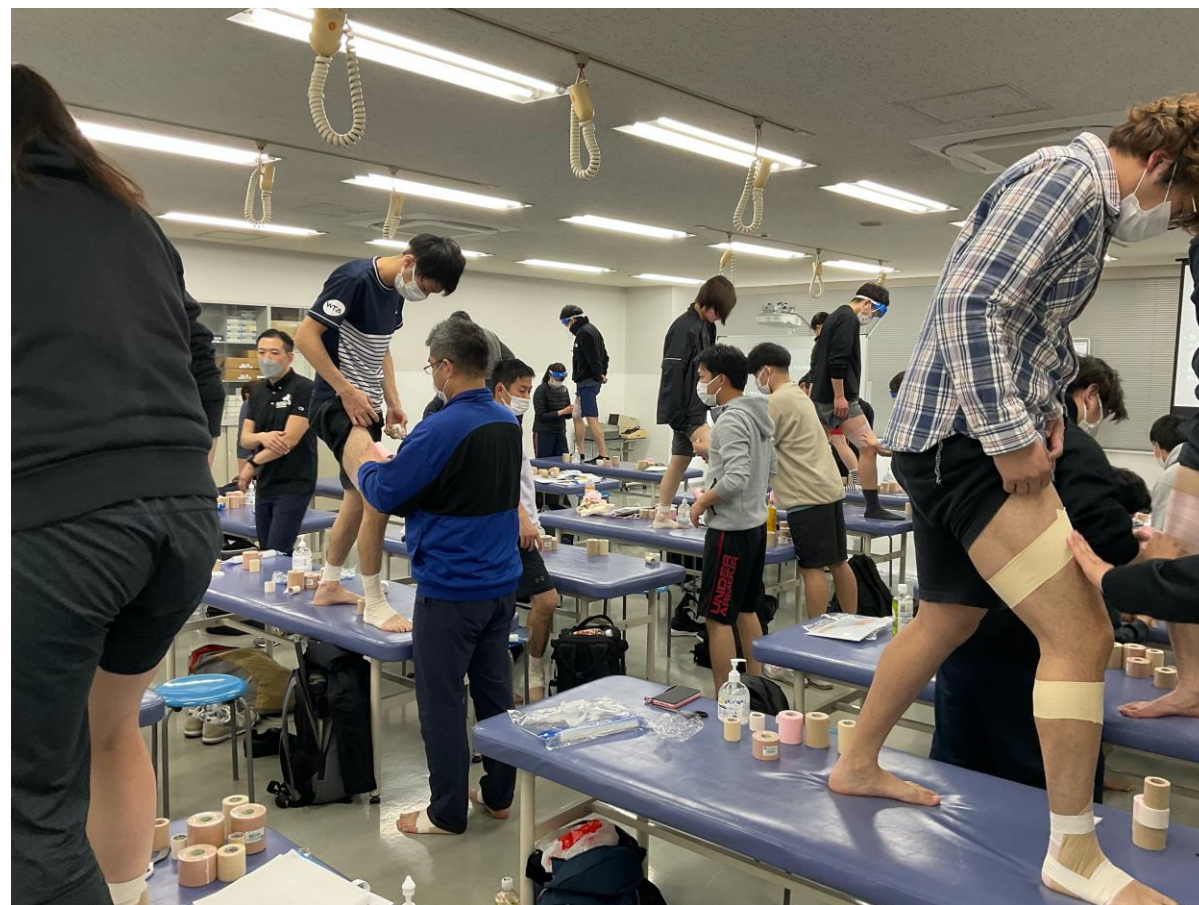
足関節と膝関節へのテーピング実習