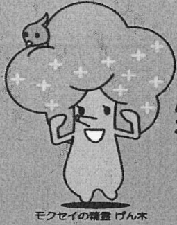
モクセイの福盤 げん木