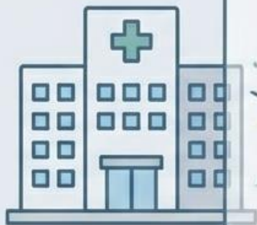
病院・クリニック

県士会に入会する最大のメリットの一つ。 それは、県士会が行政から受託する「健康 推進・予防事業」に、専門職（部員）として 直接参画できる権利を得ることです。