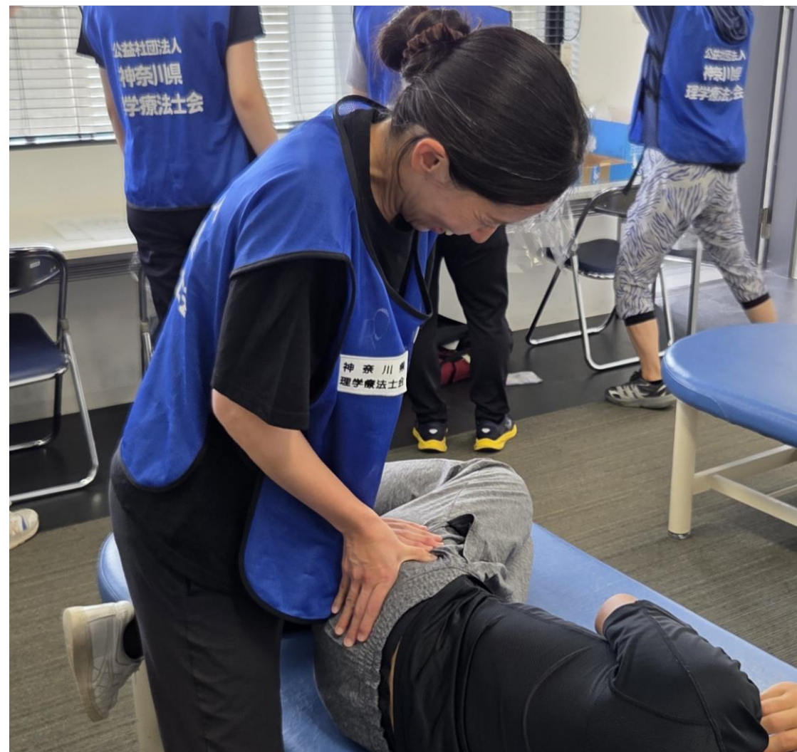
メディカルサポートを行う参加者